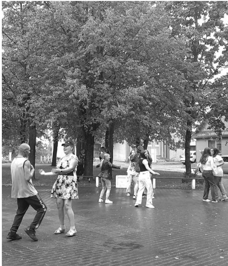
20.00 val. prasidėjęs lietus dar neišgašdino vienintelės šokėjų poros ir kelių jaunuolių.

22.30 val. užėjo lietus, tad visi, kurie norėjo jaustis saugiau, jau išskubėjo namo. Kiek linksmiau nusiteikę ir „apšilę“ ne tik nuo šokių, dar pasiliko. Nufotografuoti, esant tokiam „apšvietimui“ (menkai šviečiant vienai menkai lemputei), nepavyko – nuotraukose visai neįmanoma nieko įžiūrėti.